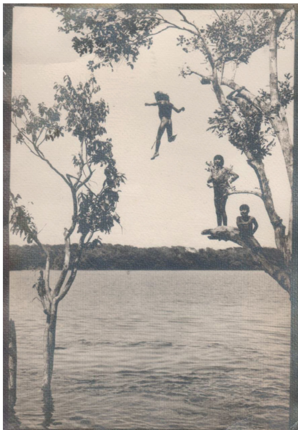
Imagem 1 – Crianças Apyãwa/Tapirapé