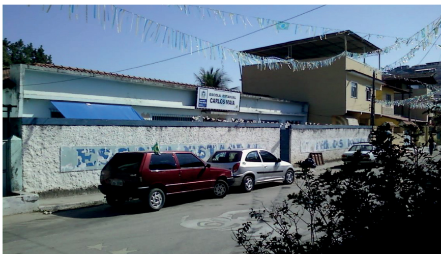
Foto: entrada da Escola Carlos Maia (Porto Velho – São Gonçalo, RJ).

Mostramos para os alunos da Escola Carlos Maia como podíamos entender que os problemas que enfrentamos na sociedade, na cidade, na periferia, podem ser encarados e resolvidos. E tentamos entender isso, em primeiro lugar, destacando uma ordem de exposição. Falamos inicialmente sobre ação social , que na época foi muito desafiador; poder contar com a experiência dos alunos e perguntar a eles: “O que vocês imaginam que possa ser uma ação social?”. Procurávamos formas de recorrer a exemplos para introduzir nossa questão, e naquela época o que nos ocorreu foi começar conversando sobre filmes de ação.