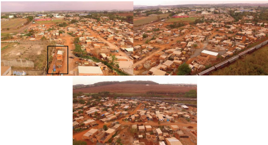
Imagem 1 – Comunidade Cidade Locomotiva (Ribeirão Preto/SP).