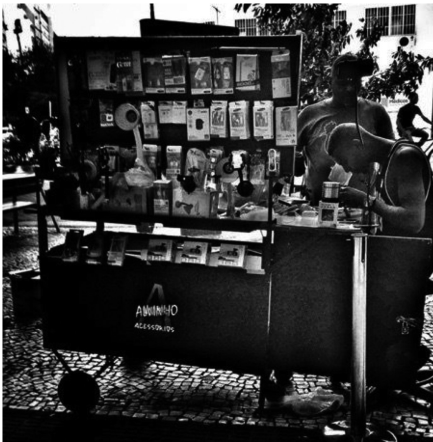
Foto 1 – Jovem vende acessórios e conserta celular. Centro do Rio de Janeiro. 21.10.2017.

Dois empregados que num café do Sul jogam um silencioso xadrez. O ceramista que premedita uma cor e uma forma. O tipógrafo que compõe bem esta página, que talvez não lhe agrade. Uma mulher e um homem que lêem os tercetos finais de certo canto. O que acarinha um animal adormecido. O que justifica ou quer justificar um mal que lhe fizeram. O que agradece que na terra haja Stevenson. O que prefere que os outros tenham razão. Essas pessoas, que se ignoram, estão a salvar o mundo.