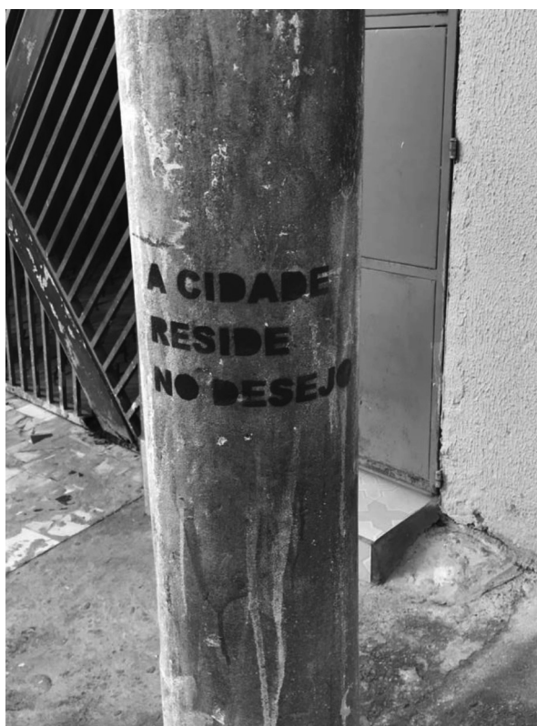
Imagem 2: serigrafia em poste no bairro do Jardim Romano, periferia da zona leste de São Paulo (Raquel de Padua Pereira, 2019).

Ao se tratar de projetos societários, trata-se também de representações sociais fomentando os processos criativos do circuito cultural periférico como um todo. E onde há um projeto societário de base territorial urbana, há um projeto cidadão, ou seja, uma