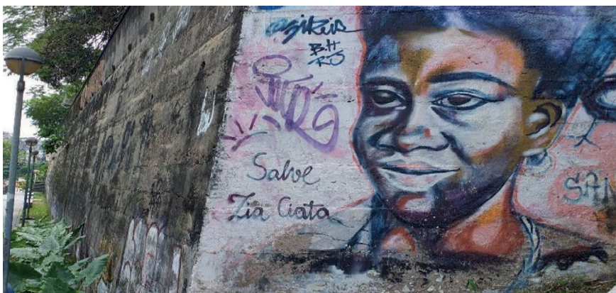
Figura 5 – O direito à interseccionalidade afirmativa. “Salve Tia Ciata”