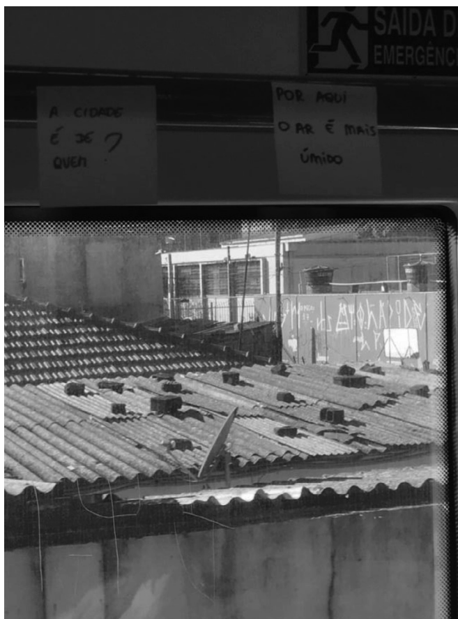
Imagem 3: janela de vagão do trem que leva à periferia leste, no contexto do espetáculo teatral A Cidade dos Rios Invisíveis , do Coletivo Estopô Balaio (Raquel de Padua Pereira, 2019).

cidade desejada, (RAIMUNDO, 2017), que se baseia na cidadania como união entre cultura e território (SANTOS, 1987). E, através do lugar, há ainda a possibilidade real de transmitir esses significados, ampliando a percepção social sobre a realidade urbana, mas não somente. Essa percepção semearia a construção de novas epistemes, periféricas, baseadas na promoção de novas práticas e novos usos do território por sujeitos corporificados que são, também, os sujeitos periféricos (D'ANDREA, 2013). Experiências, portanto, formativas e ao mesmo tempo disruptivas com a ordem hegemônica imposta pela urbanização corporativa.