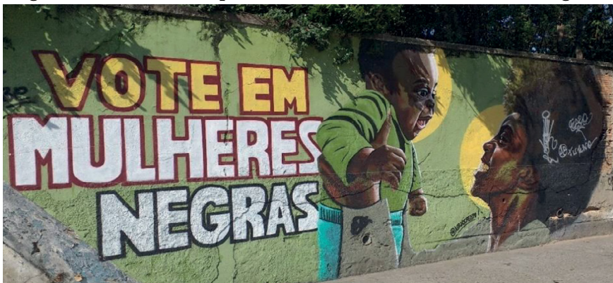
Figura 6 – O direito à representatividade. “Vote em mulheres negras”