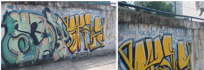
Figura 4 – O direito à resistência. “Polícia racista”