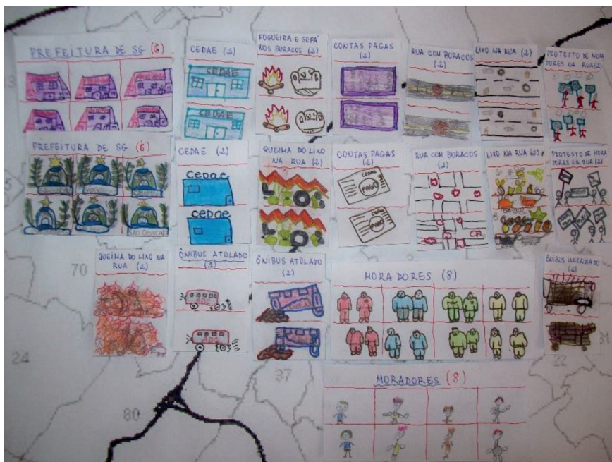
Foto: desenhos feitos duas vezes em quadrículas para a composição de legenda e do mapa, a partir das categorias da ação identificadas pelos alunos na ficha de classificação.